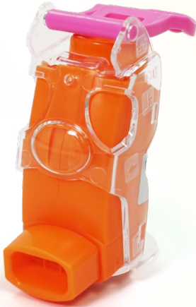
吸入トレーナー (フルプッシュ®*装着時) *噴霧補助具